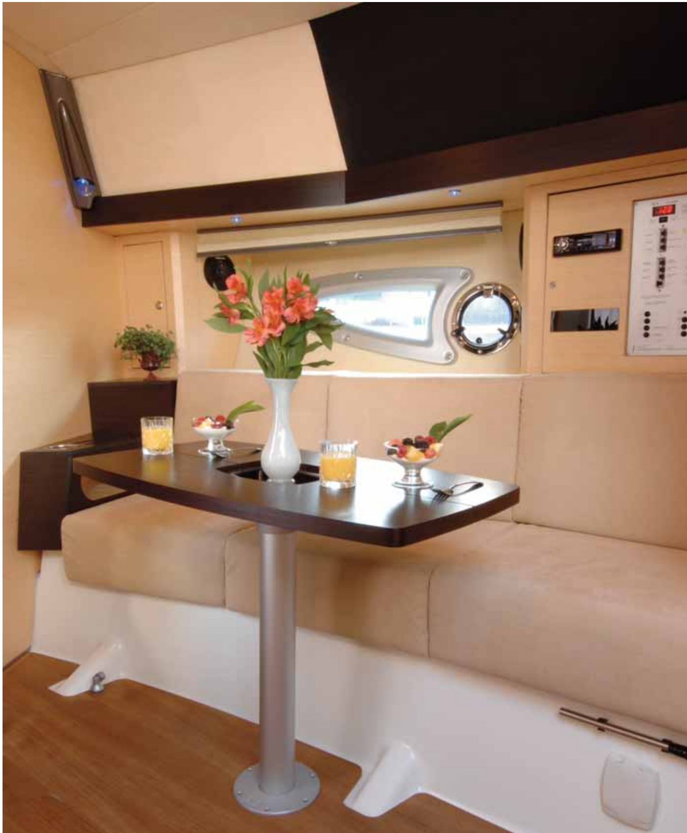
dining area - dinette