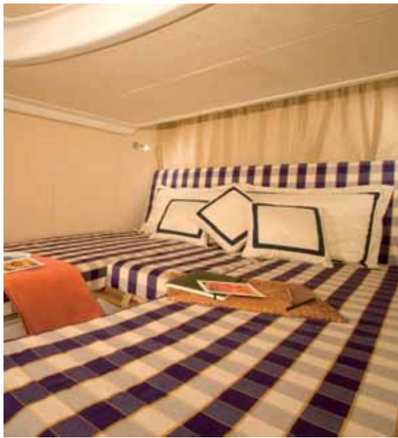
guest's cabin - cabina ospiti