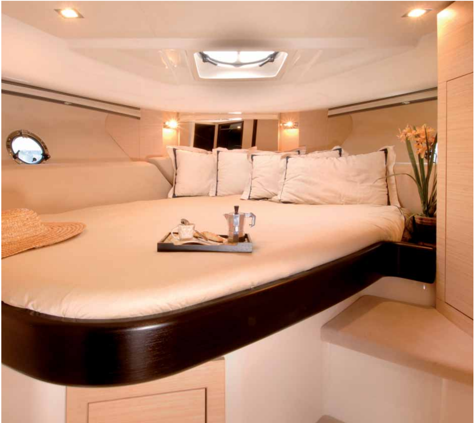
owner's cabin - cabina armatoriale