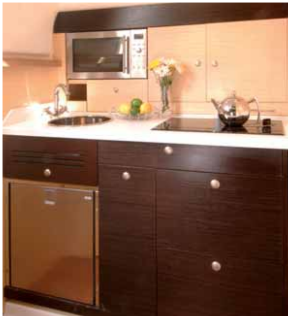
galley - cucina