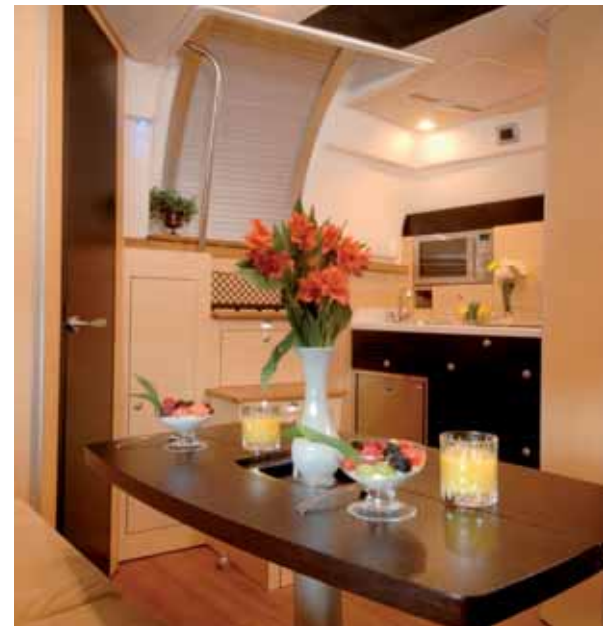
dining area / galley dinette / cucina