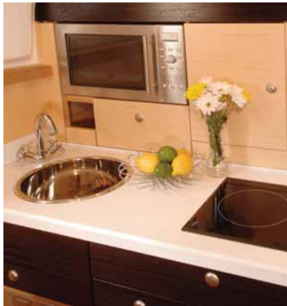
galley - cucina