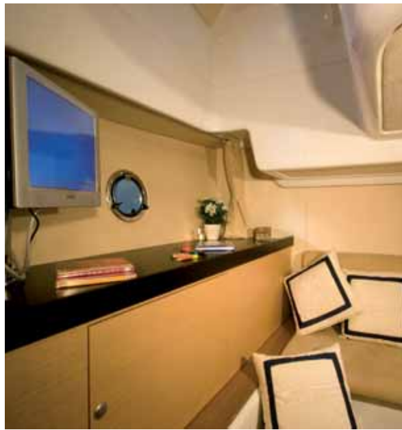
guest's cabin - cabina ospiti