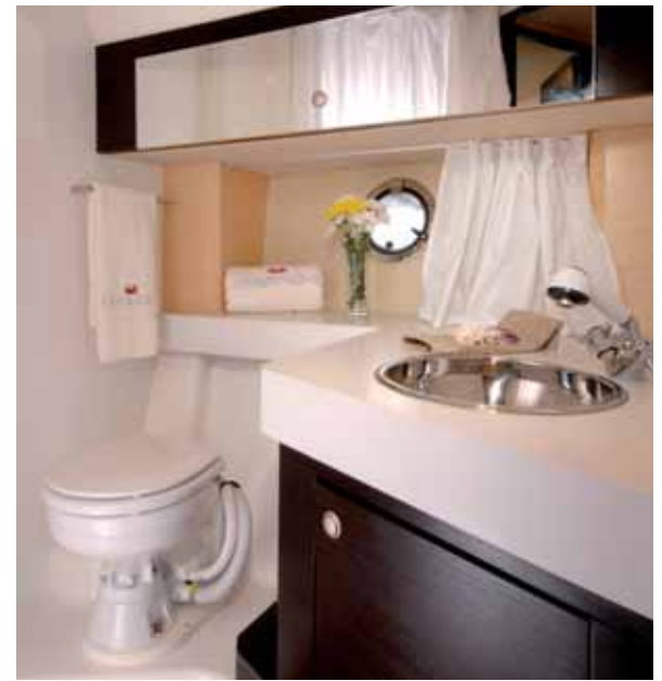
wc and shower room toilette